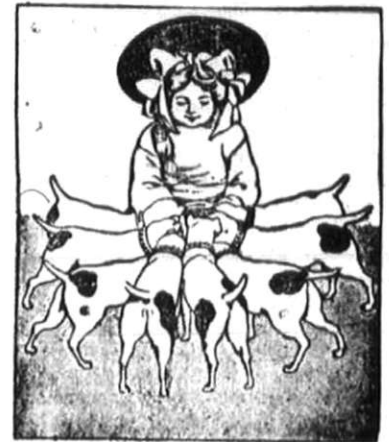
A legjobb kutya-kalács volt és marad a

— Lövöldözés. Egy osztrák tartományi fővárosban történt, hogy este holdvilágos éjjel valamely nagyon félték diák a promenádra ment sétálni és mivel bátor nem volt, magával vitte a revolverjét. Az ügyetlen azonban a revolvert kiejtette zsebéből és az a földre hulva esült. A durranás hallatára hallatára két policej bevitte a megdondolai az ifjut, gazolásra szólította fel és elnyomta 10 K erejűj. Nagykanizsa városában megtörtént már, hogy ujság-író a kávéház terraszán nagyon ügyetlenül bánt a revolverrel (a mi nem mindennapi dolog) és azt a közönség ijedelmeire elstította. Hogy pedig ma már tárcumutatságra járnak felfegyverkezve, arra talán példát a lovagkorszakban se találunk. Es mégis ez az eset is megtörtént, hogy valaki rózsás jó kedvében a meunyezetet képzelte förtelmes ellenfélnek és azon lőt lyukat. Hogy minek öröme arrol sikerült biztos adatokat szereznii, de arról sines tudomásunk, hogy a rendőrség ilyen alkalommal szokott-e folyamatba tenni eljárást?