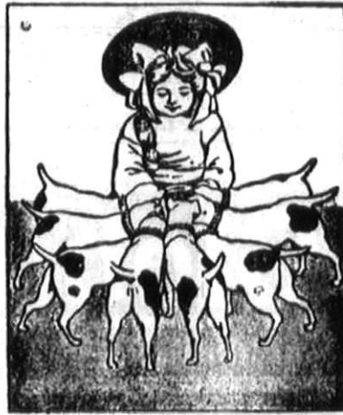
A legjobb kutya-kalács volt és marad a Fattinger-féle kutya-Kalács,

— „Milleniumtelep”, Nagyösz, Torontál-megye, kiváló minőségű, elismert fajtiszte szőlőbortványokat szállít olcsó árban Magyar vagy német vagy román vagy szerb főárjegyzék ingyen bérmentve.